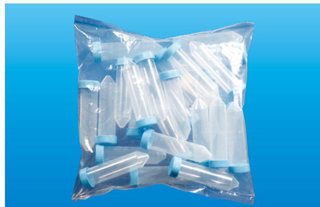
滅菌スクリュースピッツ 50mL (25本包装) 成型目盛付