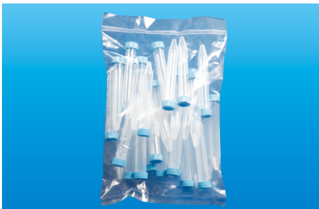
滅菌スクリュースピッツ 15mL (25本包装) 成型目盛付